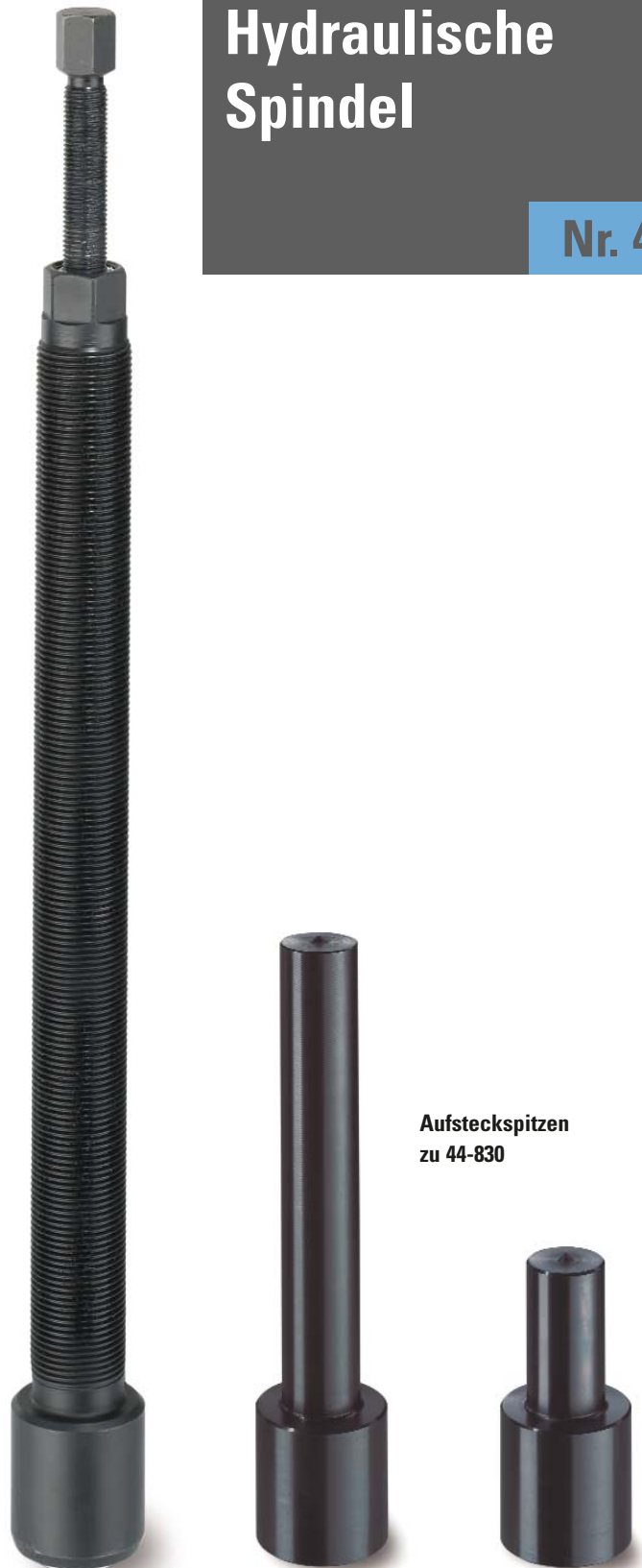
Aufsteckspitzen zu 44-830

Die so erzeugte rein axiale Kraft löst das Teil, so dass der eigentliche Abziehvorgang jetzt leicht über das große Spindelgewinde abgeschlossen werden kann.